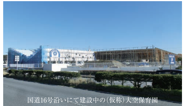
国道16号沿いにて建設中の（仮称）大空保育園

平成27年4月の開園にむけ、工事が進んでいる（仮称）大空保育園。社会福祉法人恵福社会が設置し、新年度の受入れ人数は120人で、一時保育、休日保育、病後児保育も行います。新年度の申し込みは一旦終了していますが、入園を希望される方は子育て支援課へご相談ください。