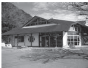
福祉作業所 うぐいす園

討論では、「障がい福祉サービスの分野への指定管理者制度がなじまないと考えられる上、保護者や利用者の期待に沿った運営ができるか不明なため、反対」という討論と、「施設運営のノウハウもあり、既存の職員を継続雇用することなので賛成」という討論がありました。